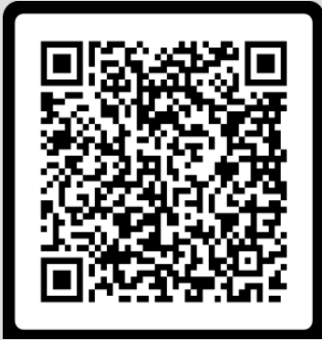
كتيب المجال العام (بهاجة)

يجب على المستثمر ضرورة التنسيق مع الإدارة العامة لتشغيل وصيانة الحدائق والمرافق وذلك لتزويده بجميع العناصر الخاصة بالحديقة والواجب صيانتها من قبل المستثمر، وتقديم الجدول الزمني الخاص بذلك واعتماده من قبلهم، وتزويد الإدارة المختصة بالإدارة العامة للاستثمار والتخصيص بصورة منه.