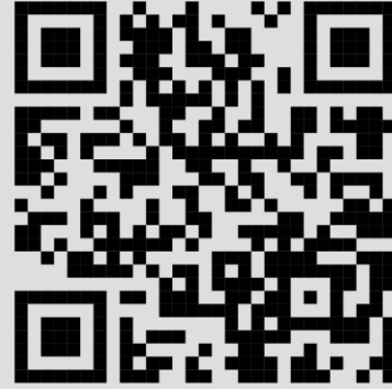
اشتراطات تنفيذ الحدائق المتوسطة.